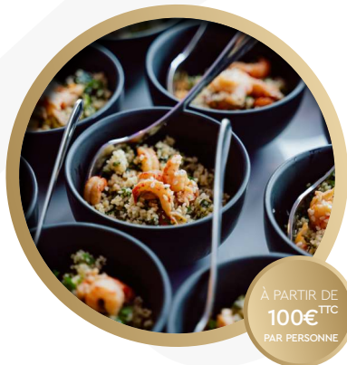
FORMULE COCKTAIL APÉRITIF