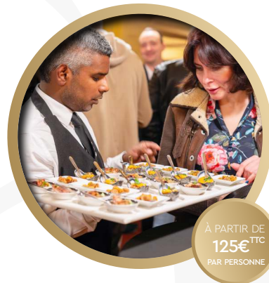
FORMULE COCKTAIL DÎNATOIRE