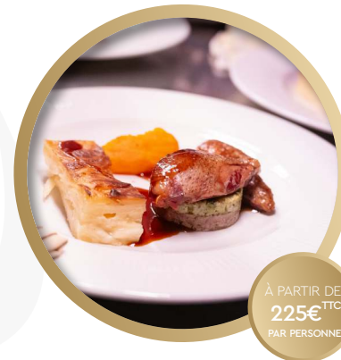
FORMULE DÎNER DE GALA